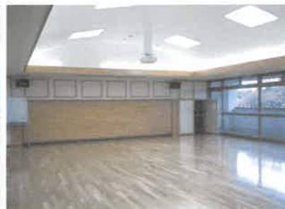
2階 ふれあいミニホール