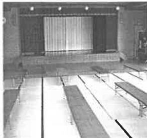
大広間 (カラオケ、舞台催し物等)