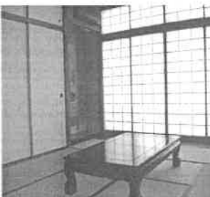
(なぎさ) 特別室 (ちどり)