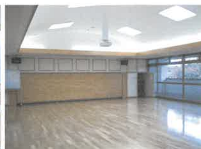
2階 ふれあいミニホール